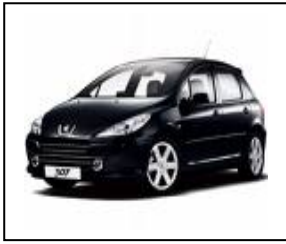
photo : Peugeot 307 6

Le design protège la forme extérieure d'un produit en deux dimensions (dessin; p. ex. le motif d'un tissu) ou d'un objet en trois dimensions (modèle, p. ex. la forme d'une brosse à dents, d'une voiture). La forme se caractérise par la disposition de lignes, de surfaces, de contours ou de couleurs, ou encore par le matériau utilisé. Il peut être protégé à condition d'être nouveau ou de se distinguer de designs existants par des caractéristiques majeures. Il n'est pas toujours évident de déterminer ce qui est véritablement nouveau de ce qui ne l'est pas (p. ex. le design de la nouvelle « Peugeot 307 », avec son capot raccourci et ses projecteurs effilés est protégé).